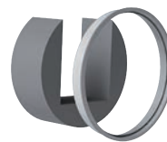
ACOUS Mousse acoustique