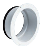
MP-J Manchette à joint