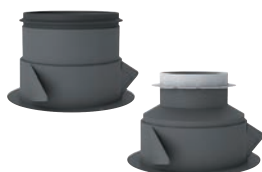
MP3-J Manchon placo 3 griffes