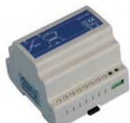
SATD1-12 Transformateur de sécurité